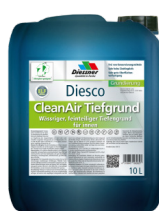
CleanAir Dybdegrunder W