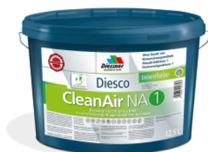
CleanAir NA 1