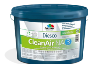
CleanAir NA 3