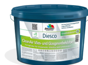
CleanAir Filt- og Vævklæber