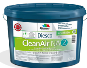
CleanAir NA 2