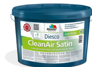
CleanAir Satin vægmalning