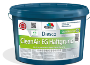
CleanAir EG Haftgrund