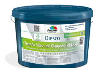
CleanAir Filt- og Vævkæber