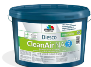
CleanAir NA 3