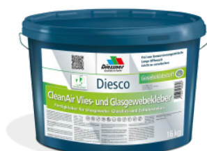
CleanAir Filt & vævklæber