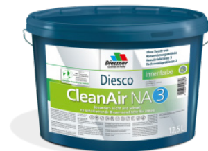
CleanAir NA 3