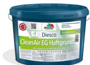
CleanAir EG Haftgrund