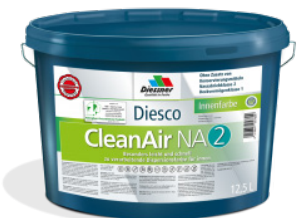
CleanAir NA 2