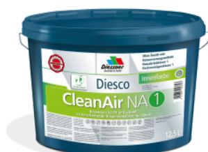
CleanAir NA 1