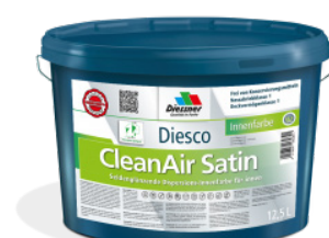
CleanAir Satin vægmaling